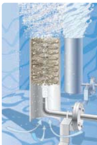
アクアブラスターのしくみ

空気を送り込むことで、下から水を吸い上げ、内部で激しく気液接触させて、酸素を水中に送り込みます。詳しくはホームページの動画をご覧ください。